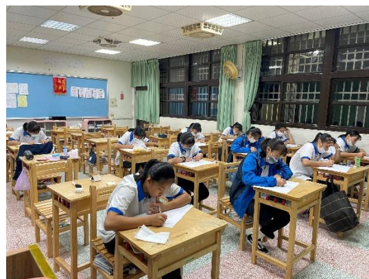
實際進行生涯價值觀測驗