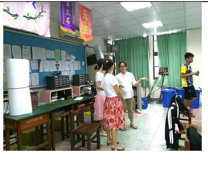
與觀課教師進行交流及討論。